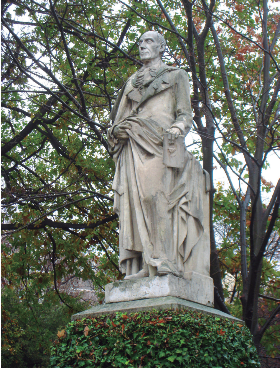
Mausoleu de Mariano Lagasca al cementiri del Poblenou, propietat de la Reial Acadèmia de Ciències i Arts de Barcelona.